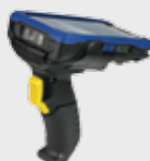
• 94ACC0170 Empuñadura