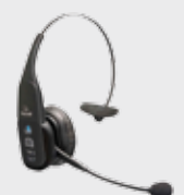
• 94ACC0127 Cascos Bluetooth VXi B350-XT