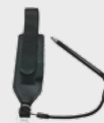
• 94ACC0133 Correa de mano (incluida)