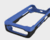
• 94ACC0132 Carcasa de goma